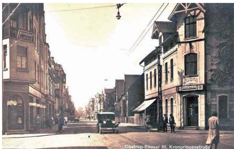
Lange Straße, ehemals Kronprinzenstraße 1925

Parken auf der Lange Str. inklusive der Ladeflächen ..... 30 Minuten in den Seitenstraßen bis ca. 50 Meter vor der Querstr. .... 3 Stunden dahinter ..... ohne zeitliche Begrenzung